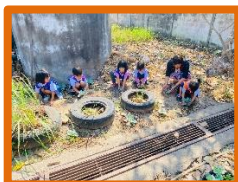
ภาพเด็กปลูกผักสวนครัว