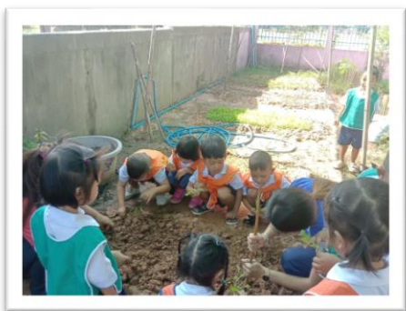
ภาพบ่อปุ๋ยหมัก